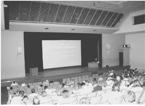
第5回 6月11日・なかのZERO 講師 岸岡勝美氏 受講者 205名